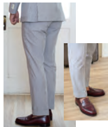
これがこだわったパンツのラインふくらはぎの部分を少し太くしながら全体的なシルエットが細く見えるように仕上げました!