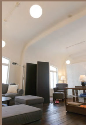
▲高さ 3.5m の天井。天井が高いのでより広く感じます。美しく R の曲線を描くアーチ。

▲淀屋橋サロンを構えるのは大正 15 年に建築された大阪市の有形文化財“船場ビルディング”、その 411 号室に移転オープンをしました！ 今までの約2倍のゆったりとした広さの淀屋橋サロンに是非遊びに来て下さい！