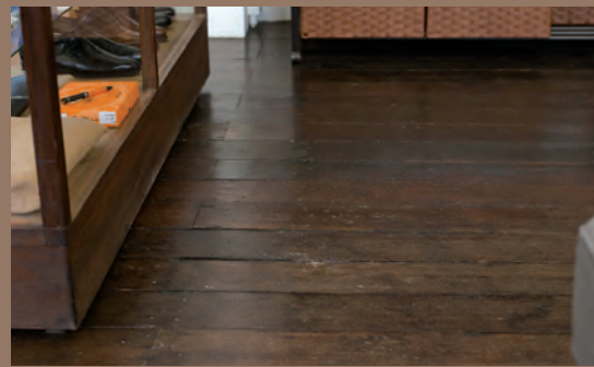
▲建設当時の木の床。大正 15 年に建築された当時の木の床がそのまま使われています。歩くときとぎとぎと木の響きがかかるのが心地よいです！

▲淀屋橋サロンを構えるのは大正 15 年に建築された大阪市の有形文化財“船場ビルディング”、その 411 号室に移転オープンをしました！ 今までの約2倍のゆったりとした広さの淀屋橋サロンに是非遊びに来て下さい！