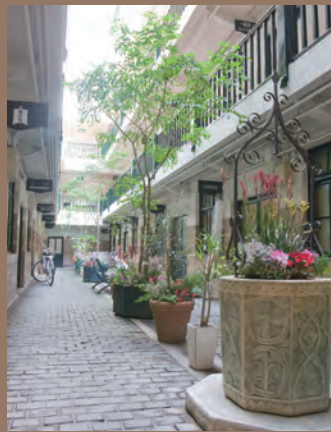
▲何か外国に迷いこんだ様なこの外観。毎日見っていますが、全くあきない美しい景色です。