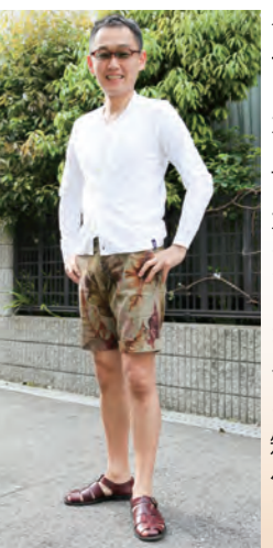
◀ ニットカーディガン + Tシャツ + パンツ